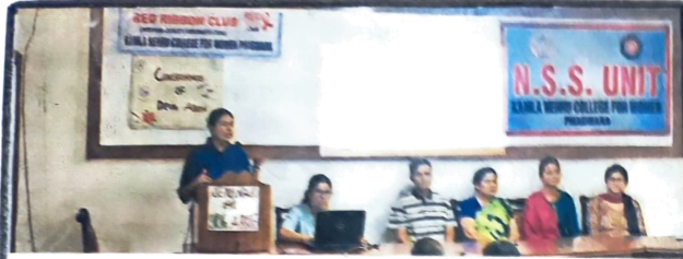
सेमिनार में भाग लेते हुए कालेज के विद्यार्थी • सौ कालेज