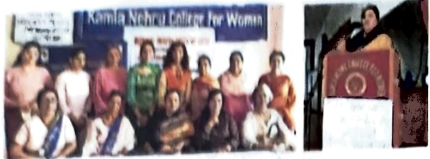
अधिकांश समूह स्टाफ सदस्य। (दाएँ) कैम्प को समोचित करते हुए विशेषज्ञ।