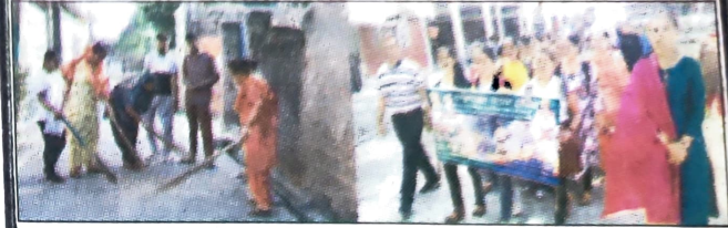
स्वच्छ भारत अभियान के तहत गांवों का दौरा कर सफाई करते कालेज वालंटियर्स।