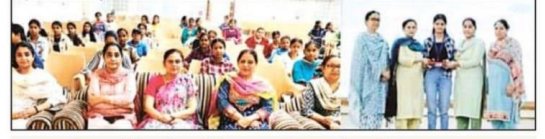
कमला नेहरू कॉलेज में आयोजित पंजाब दिवस की तस्वीरें।