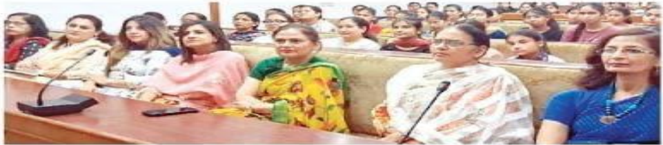
फगवाड़ा के कमला नेहरू कॉलेज फॉर वूमैन में आयोजित सेमिनार में उपस्थित छात्राएं।