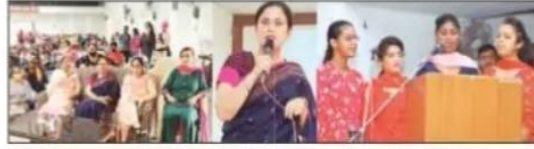
कमला नेहरू कालेज में अध्यापक दिवस मौके कार्यक्रम की तस्वीरें।